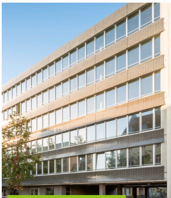
Immeuble H. Trium - Hansastrasse 10 - Munich